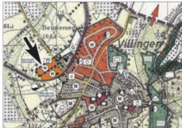
Abbildung: Lageplan der Änderung des Flächennutzungsplanes im Stadtteil Villingen (Karte: unmaßstäblich, genordet)

Das Planänderungsgebiet befindet sich am nordwestlichen Ortsrand von Villingen, es schließt unmittelbar südwestlich an die Bahnhofstraße an. Die südliche Begrenzung bildet das durch den Bebauungsplan Nr. 2.05 ausgewiesene Baugebiet „Die Herrenbeune“, im Westen und Norden grenzen landwirtschaftlich genutzte Flächen an. Die Lage und Abgrenzung des Gebietes ist auf der nachfolgenden Abbildung dargestellt.